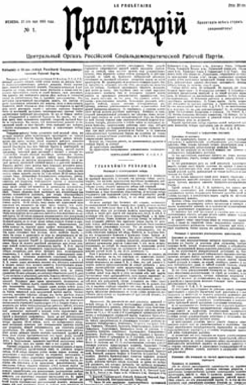
Первая страница большевистской газеты «Пролетарий» № 1, 27 (14) мая 1905 г. со статьёй В. И. Ленина «Извещение о III съезде Российской социал-демократической рабочей партии» и главнейшими резолюциями съезда